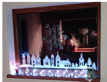
Obr: 2 I tak může vypadat okno autobusové čekárny

Na organizaci akce se podíleli i mnozí sousedé. Borůvkovi přeparkovali auta a parkoviště u kapličky se stalo místem našeho sousedského setkání. Odmetli jsme sníh a shodili tající závěj ze střechy kapličky. Autobusovou čekárnu si pěkně vyzdobili, vše nasvítili, ozvučili, připravili a dopravili.