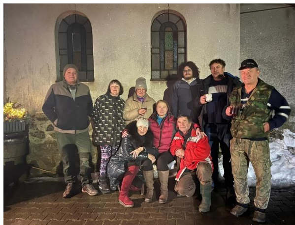
Obr: 4 Společné foto na závěr akce (nejsou tu již všichni zúčastnění – příště musíme společné foto udělat již na začátku!)

A protože se říká, že „ Jednou je nikdy, ale dvakrát je už zvyk, “ doufám, že tento nový zvyk se v Geršově udrží i po další léta a stane se tak tradiční akcí. No, to záleží jen na nás.