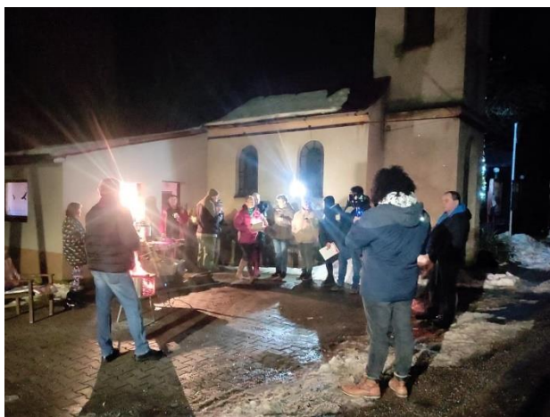
Obr: 3 Zpívání koled