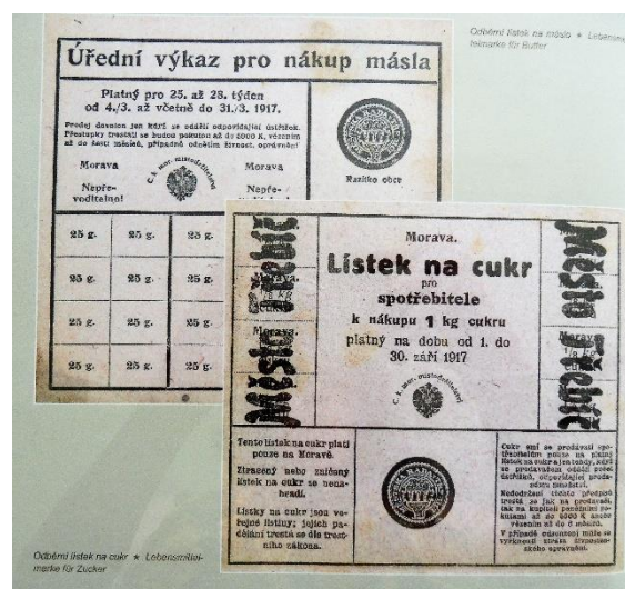
Foto: 1 Potravinové lístky

Už pár dní po zahájení války se ukázalo, že spekulace se zbožím budou největším nepřítelem. Úřady se tomu snažily zamezit. Dělal se soupisy zásob, přitom zatajování zásob bylo trestné. Bylo nařízeno zejména potraviny výrazně označovat cenami. Ceny se zvyšovaly a byl stále citelnější nedostatek potravin. Objevil se hlad, fronty před obchody a přidělový systém. Uhry byly sice agrární zemí, ale odmítly své přebytky dodávat do jiných zemí monarchie i armádě. Za této situace přešly tyto povinnosti na země Koruny české.